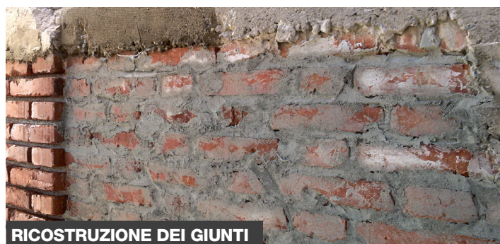
RICOSTRUZIONE DEI GIUNTI