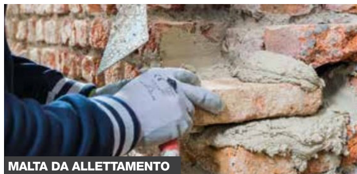
MALTA DA ALLETTAMENTO